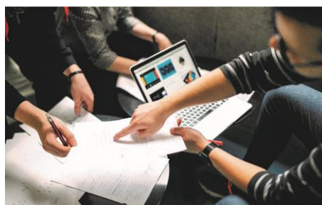
Séance de groupe